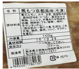
【配送荷姿の画像例】